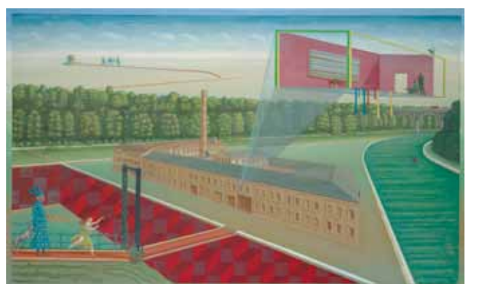
1e ligne : Kugler 360° , façade ouest, Kugler 360° , angle sud-ouest, 2010, 110 x 180 cm, huile sur lin